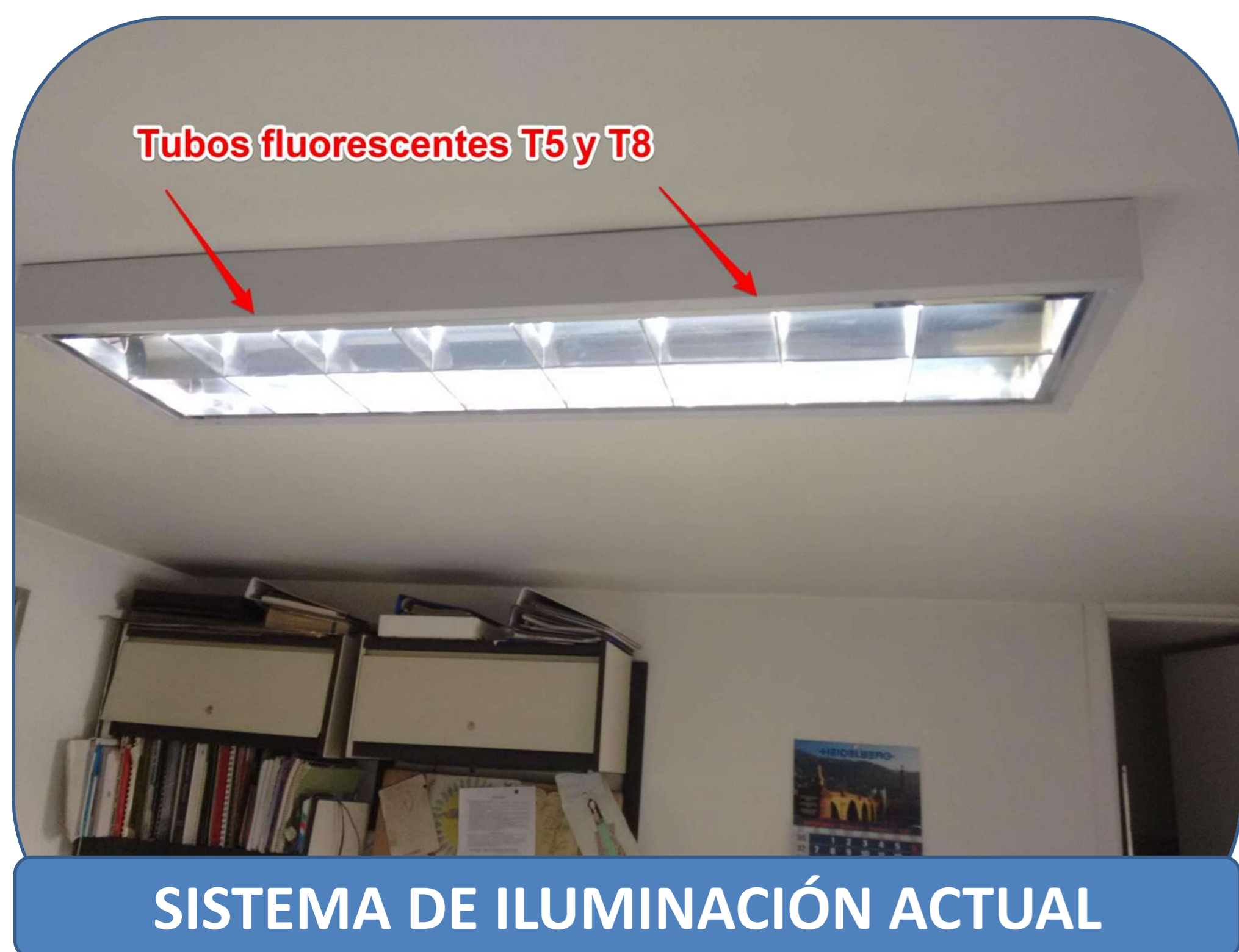
SISTEMA DE ILUMINACIÓN ACTUAL